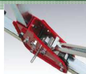
Mécanisme à cliquet