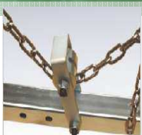
Poulie de renvoi