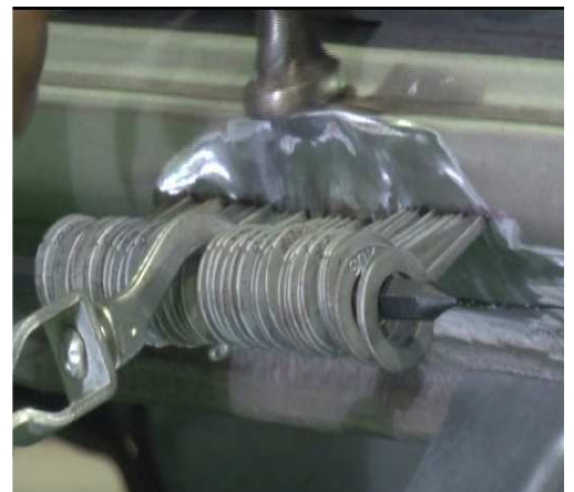
ACCROCHAGE DE LA TRINGLE