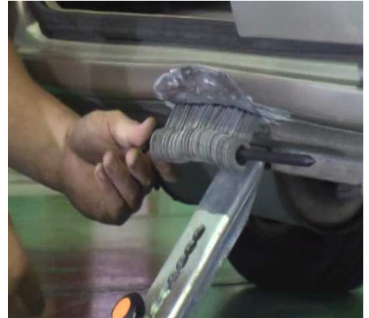
POSE DE LA TRINGLE