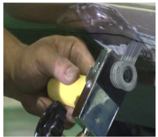
POSE DES RONDELLES